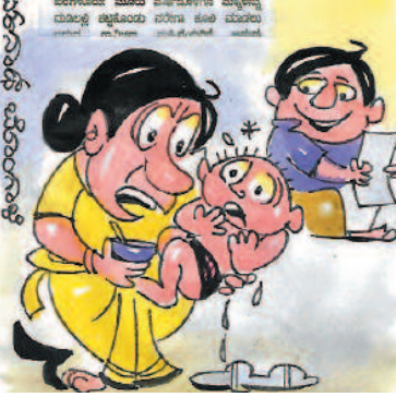
ರಗಲೆ ಮಾಡದೆ ತಪ್ಪಗೆ ಊಟ ಮಾಡಿದ್ದ ಸರಿ, ಇಲ್ಲ ಅಂದ್ರೆ ನೋಡು 'ಕೂಸಿನ ಮನೆ'ಗೆ ಬಿಟ್ಟು ಬರ್ತೀನಿ!