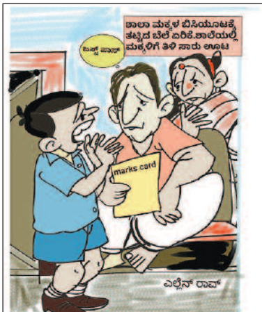
ಸುಮ್ಮಿರಪ್ಪ! ಅದು ತಿಂದು ಇಷ್ಟು ಬಂದಿದ್ದೇ ದೊಡ್ಡ ಸಾಧನೆ ಅಂತ ತಿಳ್ಕೊಂಡು ಬಿಡು!