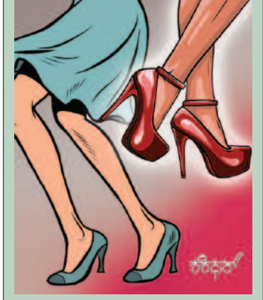
ರೋಮಿಯೋಗಳಿಗೆ ಬಾರಿಸಲು ಒಳ್ಳೆಯ ಗ್ರಿಪ್ ಸಿಗುತ್ತದೆಂದು.