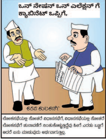
ಲೋಕಸಭೆಯಲ್ಲಿ ನೋತರೆ ಐದಾನಂಜೆಗೆ, ಐದಾನಂಜೆಯಲ್ಲಿ ನೋತರೆ ಲೋಕಸಭೆಗೆ ಸುನಾವಣೆಗೆ ಸಂಪುರ್ಣವಾಗಿ ಸಿದ್ಧವಾಗಿ ಕೀರ್ತಿ ಎರಡು ಒಟ್ಟಿಗೆ ಅಂದರೆ ಏನು ಮಾಡುವುದು ಅರ್ಥವಾಗುತ್ತಾಲ್ಲ.