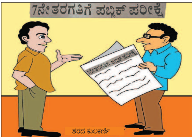
ಎಸ್‌ಎಸ್‌ಎಲ್‌ಸಿ, ಪಿಯುಸಿ ಜೊತೆ ಏಳನೇ ತರಗತಿಯ ಮಕ್ಕಳೂ ಪರೀಕ್ಷಾ ಭಿತಿಯಲ್ಲಿ ಆತ್ಮಹತ್ಯೆಗೆ ಶರಣಾಗುವ ಸುದ್ದಿ ಮುಂದಿನ ದಿನಗಳಲ್ಲಿ ಬರುತ್ತದೆ!