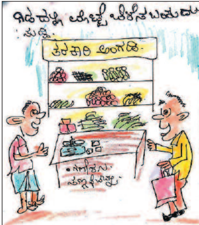
ಬಂದು ಕೇಜಿ ಮೊಟ್ಟೆಗೆ ಬೆಲೆ ಎಷ್ಟು ಸ್ವಾಮಿ?