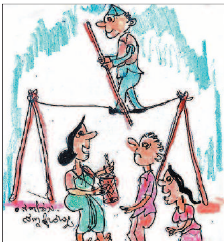
ಜುನಾವಣೆಗೆ ನಿಲ್ಲುತ್ತಾರಂತೆ ಅದಕ್ಕೆ ಟ್ರೈನಿಂಗ್ ತೆಗೆದುಕೊಳ್ಳುತ್ತಿದ್ದಾರೆ...!