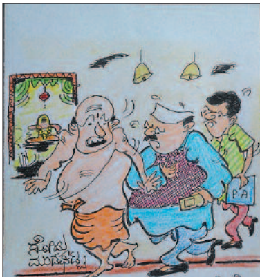
ವಿಶೇಷ ಪೂಜೆ ಏನೂ ಬೇಡ ಬಿಡಿ... ಜೈಲಿಗೆ ಹೋಗಿ ಬಂದಿದ್ದೀರಿ ಅಂದ್ರೆ ಮುಖ್ಯಮಂತ್ರಿ ಆಗಿಯೇ ಆಗಿರೋ..?