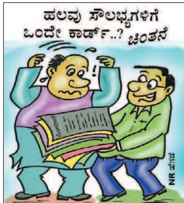
ಇದೇ ರೀತಿ ಹಲವು ಕೇಸ್‌ಗಳಿಗೆ ಒಂದೇ ಜಾಮೀನು... ಅಂತಾನೂ ಬಂದ್ರೆ ಚೆನ್ನಾಗಿತ್ತು.. ಅಲ್ಲೇ ಸಾರ್...!