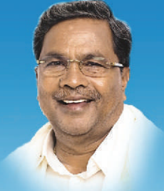
ಶ್ರೀ ಸಿದ್ದರಾಮಯ್ಯ ಸನ್ಮಾನ್ಯ ಮುಖ್ಯಮಂತ್ರಿಗಳು