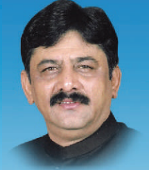
ಶ್ರೀ ಡಿ.ಕೆ. ಶಿವಕುಮಾರ್ ಸನ್ಮಾನ್ಯ ಇಂಧನ ಸಚಿವರು