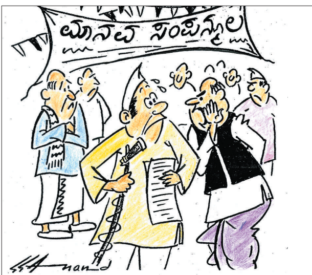
ನೆಟ್ಟಿಗೆ ಓದೋಕೂ ಬರಲ್ವಲ್ಲ... ಅದು ಮಾನವ ಸಂಪನ್ಮೂಲ, ಮಾವನ ಸಂಪನ್ಮೂಲ ಅಲ್ಲ!