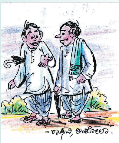
ಸಂತೋಷದ ಸುದ್ದಿ... ನನ್ನ ಹೆಂಡತಿ ನೋಡ್ತಾಯಿದ್ದ ಧಾರವಾಹಿ ಮುಗಿಯಿತು..