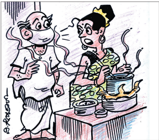
ಹಂದಿ ಜ್ವರಕ್ಕೆ ಹೆದರಿ ಮೂಗು ಮುಚ್ಚಿ ಕೊಳ್ಳಲಿಲ್ಲ ಕಣೇ, ನೀನು ಮಾಡುತ್ತಿರುವ ಹೊಸ ರುಚಿಯ ವಾಸನೆಯಿಂದ!