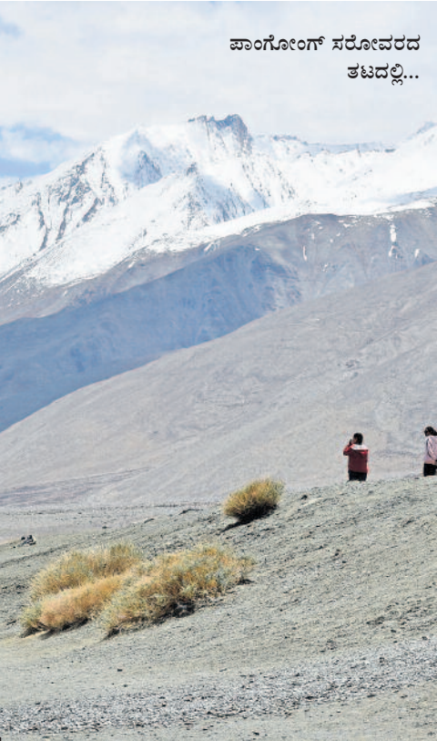
ಪಾಂಗೋಂಗ್ ಸರೋವರದ ತಟದಲ್ಲಿ...