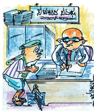
ಮೊನ್ನೆ ಸಾಲ ತೀರಿಸಿದ್ದನ್ನ ವಾಪಸ್ಸು ಕೊಡಿ ಸಾರ್! ಮನ್ನಾ ಆಗುತ್ತೆ ಅಂತ ಗೊತ್ತಿರಲಿಲ್ಲ ತೀರಿಸಿಬಿಟ್ಟೆ!