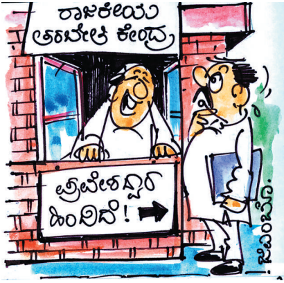
ರಾಜಕಾರಣಿಗೆ 'ಹಿಂಬಾಗಿಲ ಪ್ರವೇಶ'ವೂ ಗೊತ್ತಿರಬೇಕು! ನಾವಿಲ್ಲಿ ಪ್ರವೇಶದಲ್ಲೇ ಆ ಪಾಠ ಕಲಿಸಿಕೊಡುತ್ತಿದ್ದೇವೆ!