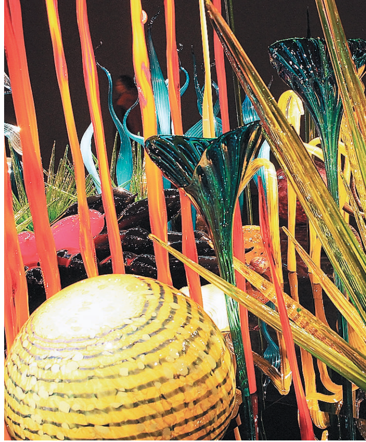
ಸಮುದ್ರದ ಅಡಿಯಲ್ಲಿ ಗಾಜಿನ ವಿನ್ಯಾಸ