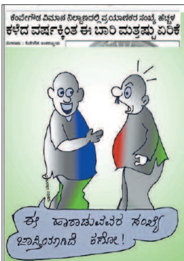
ಈ ಹಾರಾಡುವವರ ಸಂಖ್ಯೆ ಜ್ಞಾನಿಯಾಗದೆ ಕಳೋ!