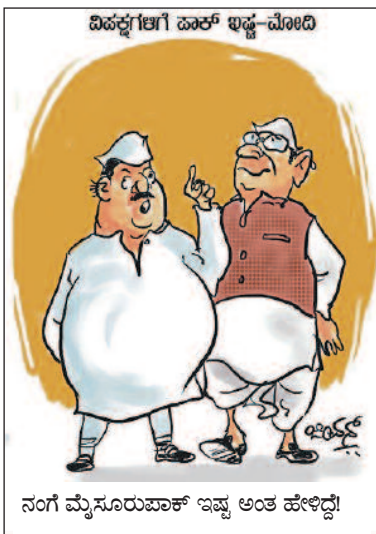
ನಂಗೆ ಮೈಸೂರುಪಾಕ್ ಇಷ್ಟ ಅಂತ ಹೇಳಿದ್ದೆ!