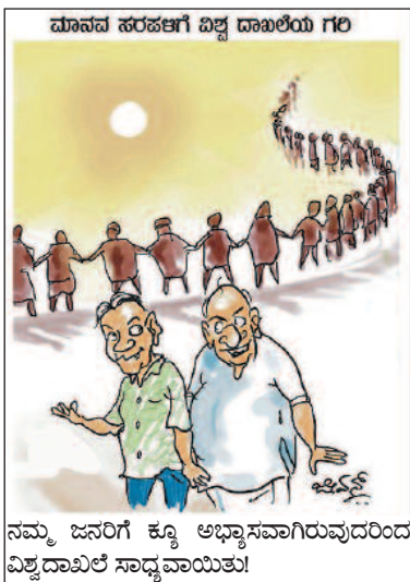
ನಮ್ಮ ಜನರಿಗೆ ಕ್ಯೂ ಅಭ್ಯಾಸವಾಗಿರುವುದರಿಂದ ವಿಶ್ವದಾಖಲೆ ಸಾಧ್ಯವಾಯಿತು!