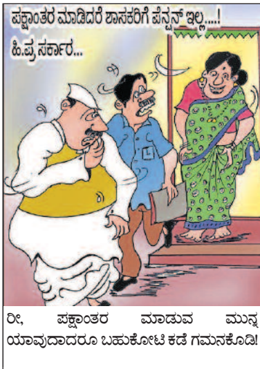
ರೀ, ಪಕ್ಷಾಂತರ ಮಾಡುವ ಮುನ್ನ ಯಾವುದಾದರೂ ಬಹುಕೋಟಿ ಕಡೆ ಗಮನಕೊಡಿ!