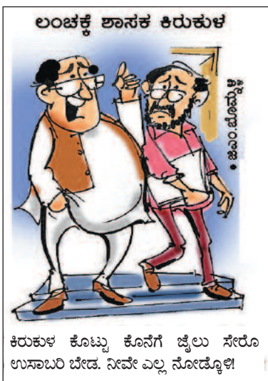
ಕಿರುಕುಳ ಕೊಟ್ಟು ಕೊನೆಗೆ ಜೈಲು ಸೇರೋ ಉಸಾಬರಿ ಬೇಡ. ನಿವೇ ಎಲ್ಲ ನೋಡೋಳಿ!