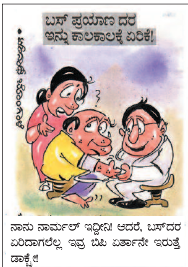
ನಾನು ನಾರ್ಮಲ್ ಇದ್ದೀನಿ! ಆದರೆ, ಬಸ್‌ದರ ಏರಿದಾಗಲೆಲ್ಲ ಇವು ಬಿಸಿ ಏರ್ತಾನೇ ಇರುತ್ತೆ ಡಾಕ್ಟರ್!