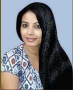
ಕಾವ್ಯ ರಿಷಿ (ಚಿತ್ರನಟಿ)