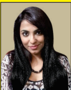
ಸ್ವರ್ನಾಲಿ ನಾಯಕ್ (ಚಿತ್ರನಟಿ)