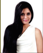
ಹಾರಿನಿ ರಿಷಿ (ಚಿತ್ರನಟಿ)