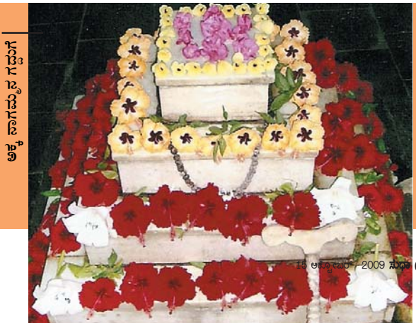
ಅಕ್ಕ ನಾಗಮ್ಮನ ಗದ್ದುಗೆ