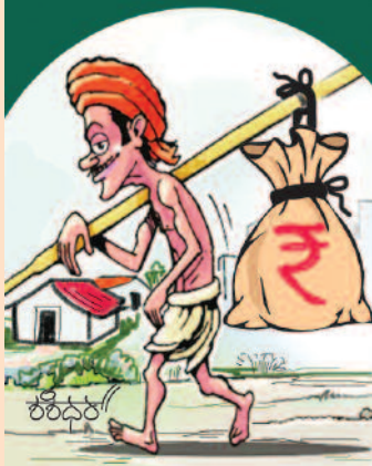
ಸಾಲವೇ ರಕ್ತ, ಸಾಲ ಮನ್ನಾವೇ ಮಾಂಸ.