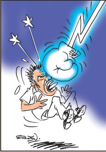
ದೇವನಿತ್ತ ಶಿಕ್ಷೆಗೆ ಮೇಲ್ನವಿ ಸಲ್ಲಿಸಲಾಗದು!