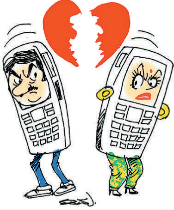
ಮೊಬೈಲ್‌ನ ಕರೆನ್ನೆ, ಮುಗಿಯುವ ತನಕ!