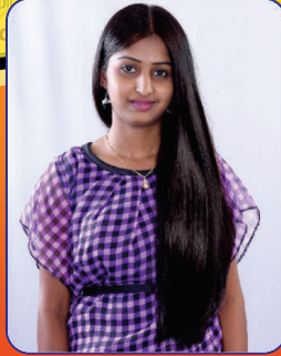
ಕೂದಲು ಆರೋಗ್ಯವಾಗಿ ಮತ್ತು ದಟ್ಟವಾಗಿ ಬೆಳೆದಿರುವುದು