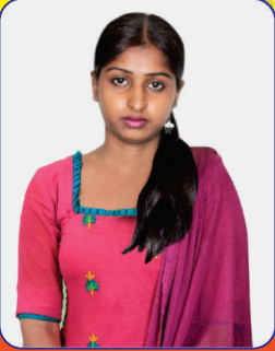
ಕೂದಲು ಉದುರುವುದು ನಿಂತು ಬೆಳೆಯಲು ಪ್ರಾರಂಭಿಸಿರುವುದು