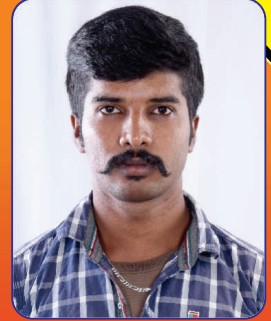
ಕೂದಲು ಆರೋಗ್ಯವಾಗಿ ಮತ್ತು ದಟ್ಟವಾಗಿ ಬೆಳೆದಿರುವುದು

ನಾನು ಬೆಂಗಳೂರಿನಲ್ಲಿ ಖಾಸಗಿ ಕಂಪನಿಯೊಂದರಲ್ಲಿ Business Development Executive ಆಗಿ ಕೆಲಸಮಾಡುತ್ತಿದ್ದೇನೆ ಬಹಳಷ್ಟು ಸಮಯ ಹೆಲ್ಮೆಟ್ ಧರಿಸಿ ಓಡಾಡಬೇಕಾಗುತ್ತದೆ. ಇದರಿಂದ ಕೂದಲು ತುಂಬಾನೆ ಉದುರಲು ತುರುವಾಗಿತ್ತು ಹಾಗೂ ಕೂದಲು ತುಂಬಾನೆ ತೆಳ್ಳಾಗ ತೊಡಗಿತು ನನಗೆ ತಲೆ ಬಾಚಿಕೊಳ್ಳ ಬೇಕಾದರೆ ಮುಜುಗರವಾಗುತ್ತಿತ್ತು. ಆಗ ನನ್ನ ಗೆಳತಿಯೊಬ್ಬಳು ನಿಸರ್ಗಾಲಯ ಬ್ರಾಹ್ಮೀ ಆಯಿಲ್ ಉಪಯೋಗಿಸುವಂತೆ ಸಲಹೆ ನೀಡಿದಳು ಇದನ್ನು ಉಪಯೋಗಿಸಲು ತುರು ಮಾಡಿದೆ ಈಗ ಉತ್ತಮ ಫಲಿತಾಂಶ ಸಿಕ್ಕಿದೆ.