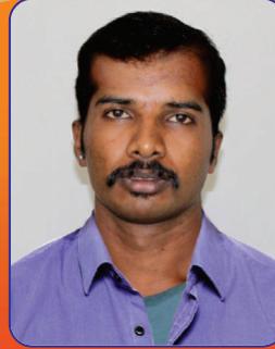
ಕೂದಲು ಉದುರುವುದು ನಿಂತು ಬೆಳೆಯಲು ಪ್ರಾರಂಭಿಸಿರುವುದು