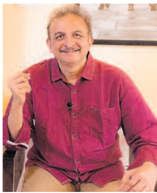
ಜಯಂತ ಕಾಯ್ಕಿಣಿ

ಎಂಬತ್ತರ ದಶಕದ ಮುಂಬೈ ಎಂಬ ವಿರಾಟ್ ಜಗತ್ತಿನ ಸೂಕ್ಷ್ಮ ಚಹರೆಗಳನ್ನು ಕಾಣಿಸುವ ಈ ಚಿತ್ರದಲ್ಲಿ ವಿಚಿತ್ರವಾದ ಪ್ರೇಮಕಥೆಯಿದೆ. ಮಹಾನಗರವೆಂಬ ಬೃಹತ್ ಯಂತ್ರದ ಸಣ್ಣ ಸಣ್ಣ ಕೀಲುಗಳಾಗಿ ಉರುಳುತ್ತಲೇ ಇರುವ ಅದೆಷ್ಟೋ ಜನರು, ವೃತ್ತದೊಳಗೇ ಸುತ್ತುವ ತಮ್ಮ ಬದುಕಿನ ಗಡಿಗಳು ಹುಟ್ಟಿಸುವ ಏಕಾಕಿತನದಿಂದ ಕಂಗೆಟ್ಟಿರುತ್ತಾರೆ. ಅಲ್ಲಿಂದ ಬಿಡುಗಡೆ ಬಯಸುತ್ತಿರುತ್ತಾರೆ. ಹೀಗೆ ತಮ್ಮ ತಮ್ಮ ಬದುಕಿನ ಕ್ರೂರ ವೃತ್ತದೊಳಗಿನಿಂದ ಬಿಡುಗಡೆ ಪಡೆಯಲು ಹಂಬಲಿಸುತ್ತಿರುವ ಎರಡು ಮನಸ್ಸುಗಳಿಗೆ ಪ್ರೇಮವು ಒಂದು ಊರುಗೋಲಾಗಿ ಒದಗಿಬರುವ ಕಥೆ ಇಲ್ಲಿದೆ. ಹಾ, ಇಲ್ಲಿ ಪ್ರೇಮ ಈ ಜಗದಿಂದ ಜಿಗಿದು ಹಾರಲು ಇರುವ ಊರುಗೋಲಷ್ಟೇ. ಅದರ ಮೇಲೆಯೇ ಜೀವದ ಭಾರ ಹೇರಿ