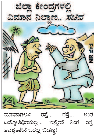
ಯಾವಾಗಲೂ ರಸ್ತೆ... ರಸ್ತೆ... ಅಂತ ಬಡ್ಡೋತ್ತಿದೀಯಲ್ಲ... ಇನ್ನೇಲೆ ನಿಗೆ ರಸ್ತೆ ಅವಶ್ಯಕತೆನೆ ಬರಲ್ಲ ಬಿಡಣ್ಣ!