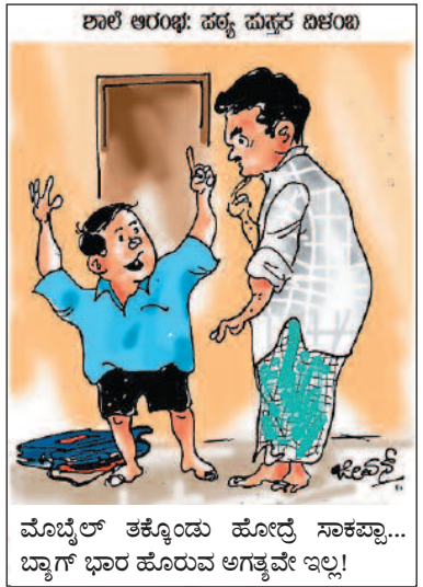
ಮೊಬೈಲ್ ತಕ್ಕೊಂಡು ಹೋದ್ರೆ ಸಾಕಪ್ಪಾ... ಬ್ಯಾಗ್ ಭಾರ ಹೊರುವ ಅಗತ್ಯವೇ ಇಲ್ಲ!