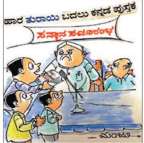
ಪದ ಪ್ರಯೋಗದ ಪುಸ್ತಕ ಸಾರ್!