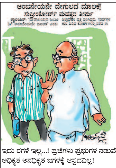
ಇದು ರಗಳೆ ಇಲ್ಲ...! ಪ್ರಜೆಗಳು ಪ್ರಭುಗಳ ನಡುವೆ ಅಧಿಕೃತ ಅನಧಿಕೃತ ಜಗಳಕ್ಕೆ ಆಸ್ಪದವಿಲ್ಲ!