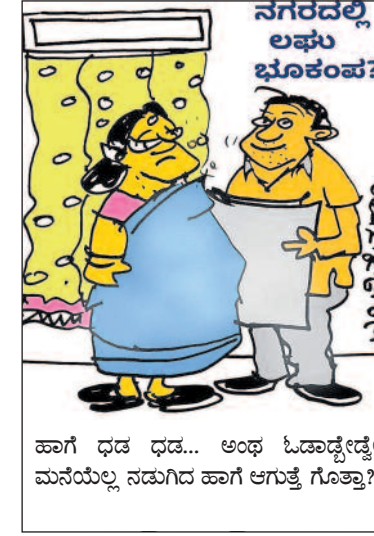
ಹಾಗೆ ಧಡ ಧಡ... ಅಂಥ ಓಡಾಡ್ಬೇಡ್ಡೇ ಮನೆಯೆಲ್ಲ ನಡುಗಿದ ಹಾಗೆ ಆಗುತ್ತೆ ಗೊತ್ತಾ?