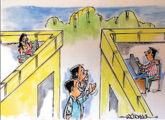
ಅವನಿಗೆ ನೆಟ್ವರ್ಕ್ ಅಲ್ಲೇ ಚೆನ್ನಾಗಿ ಸಿಗುವುದಂತೆ ಕಣೇ.