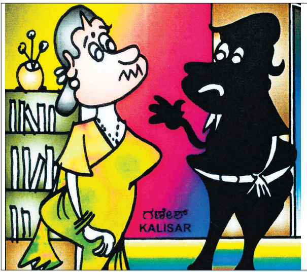
ಲೇ.. ಹೆದರ ಬೇಡ್ವೇ.. ನಾನು ನಿನ್ನ ಗಂಡ, ಟ್ರಾಫಿಕ್‌ನಲ್ಲಿ ಬೈಕ್ ಓಡಿಸ್ಸೊಂಡು ಬಂದಿರೋದಿಂದ ಈ ಬಣ್ಣಕ್ಕೆ ಬಂದಿದೀನಿ..!