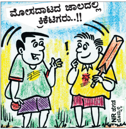
ಬ್ಯಾಟಿಂಗ್.. ಬೋಲಿಂಗ್ ಬೋಲ್ ಆಗಿದ್ದೆ. ಈಗೇನಿದ್ದೂ ಸ್ವಲ್ಪ ಹೊತ್ತು ಬೆಟ್ಟಿಂಗ್... ಫಿಫಿಂಗ್ ಆಟ ಆಡೋಣವೋ..?