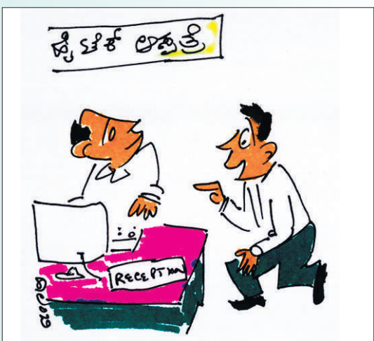
ಮತ್ತೊಬ್ಬ ದೊಡ್ಡ ಮನುಷ್ಯನ ಆರೈಕೆ ಆಗಿದೆ ಇನ್ನೇನು 'ಎದೆ ನೋವು' ಶುರುಮಾಗುತ್ತೆ! ಒಂದು ಕೋಣೆ ರಿಸರ್ವ್ ಇಡ್ವಪ್ಪಾ!