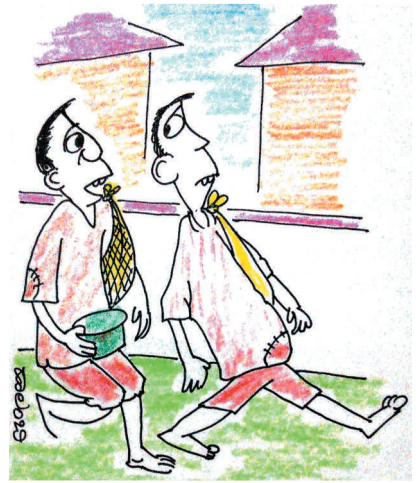
ಎಂತಹ ಕಾಲ ಬಂತು ನೋಡು, ಒಂದ್ರೂಪಾಯಿ ಕೇಜಿ ಅಕ್ಕಿ ಬಂದು ಮೂರು ದಿನಗಳಿಂದ ಉಂಡಿಲ್ಲ ಎಂದು ಬೇಡುವಂತಿಲ್ಲ!