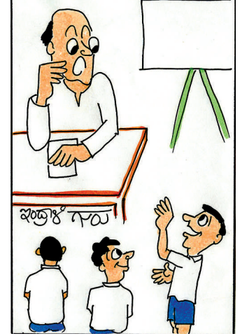
ಆಮೇಲೆ ಪಾಠ ಮಾಡಿ.. ಮೊದಲು ಹಾಲು ಕೊಡಿ ಸಾರ್..!