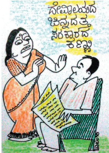
ಹಾಗೇ ನನ್ನ ಚಿನ್ನದ ಮೇಲೂ ಬಿದ್ದ ಕಷ್ಟ ಅಂತ ಎಲ್ಲ ತೆಗೆದು ಭದ್ರವಾಗಿ ಇಟ್ಟಿ ಕಣ್ಣೇ..!