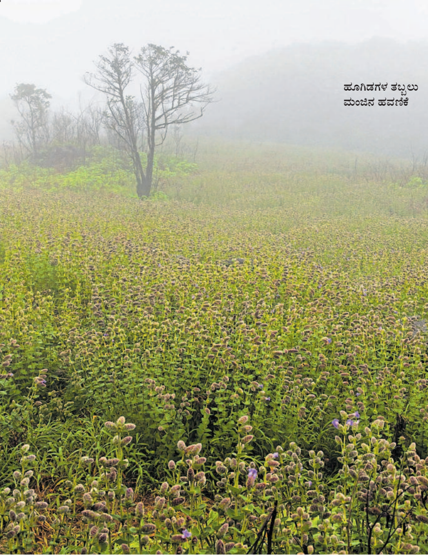
ಹೂಗಿಡಗಳ ತಬ್ಬಲು ಮಂಜಿನ ಹವಣಿಕೆ