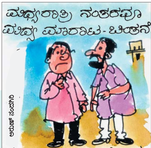
ನನ್ನನ್ನ ಕೇಳಿದ್ರೆ ಬೆಳಗಿನವರೆಗೂ ಬಾರ್ ತೆಗೆದೇಯಿರಬೇಕು..