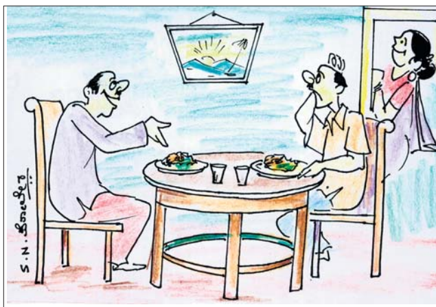
ಈ ಅಡುಗೆಯನ್ನು ನಿನ್ನ ಹೆಂಡತಿಯಿ ಮಾಡಿದ್ದಾಳೆಂದು ನನ್ನ ಹತ್ತಿರ ಬೊಗಳೆ ಬಿಡಬೇಡ ಕಣೋ.. ನೀನೇ ಮಾಡಿದ್ದು ಅನ್ನೋಕೆ ಈ ಸಣ್ಣ ಕೂದಲುಗಳೇ ಸಾಕ್ಷಿ..