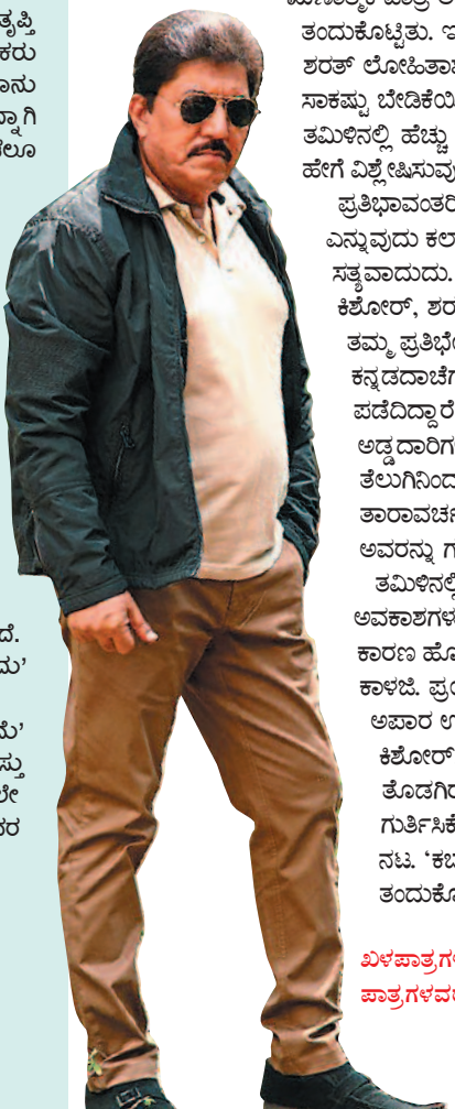
ಖಳಪಾತ್ರಗಳಿಂದ ನಾಯಕ ಪಾತ್ರಗಳವರೆಗೆ.. ದೇವರಾಜ್

ತಮಿಳಿನಲ್ಲಿ ಕಿಶೋರ್ ಅವರಿಗೆ ಹೆಚ್ಚು ಅವಕಾಶಗಳು ದೊರೆಯಲು ಮತ್ತೊಂದು ಕಾರಣ ಹೊಸಬರ ಬಗ್ಗೆ ಅವರಿಗಿರುವ ಕಾಳಜಿ. ಪ್ರಯೋಗಶೀಲ ಸಿನಿಮಾಗಳ ಬಗ್ಗೆ ಅಪಾರ ಉತ್ಸಾಹ ಹೊಂದಿರುವ ಕಿಶೋರ್, ಅಂಥ ಪ್ರಯತ್ನಗಳಲ್ಲಿ ತೊಡಗಿರುವ ತಂಡದೊಂದಿಗೆ ತಮ್ಮನ್ನು ಗುರ್ತಿಸಿಕೊಳ್ಳಲು ಹಂಬಲಿಸುವ ವಿಶಿಷ್ಟ ನಟ. 'ಕಬಾಲಿ' ಚಿತ್ರ ದೊಡ್ಡ ಹೆಸರು ತಂದುಕೊಟ್ಟ ನಂತರವೂ ಅವರಿಗೆ