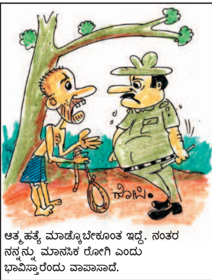
ಆತ್ಮಹತ್ಯೆ ಮಾಡ್ಕೊಬೇಕಂತ ಇದ್ದೆ. ನಂತರ ನನ್ನನ್ನು ಮಾನಸಿಕ ರೋಗಿ ಎಂದು ಭಾವಿಸ್ತಾರೆಂದು ವಾವಾಸಾದೆ.