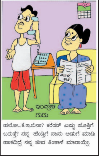
ಹಲೋ...ಕೆ.ಇ.ಬಿನಾ? ಕರೆಂಟ್ ಎಷ್ಟು ಹೊತ್ತಿಗೆ ಬರುತ್ತೆ? ನನ್ನ ಹೆಂಡ್ತಿಗೆ ನಾನು ಅಡುಗೆ ಮಾಡಿ ಹಾಕದಿದ್ದ ನನ್ನ ಜೀವ ತಿಂತಾಳೆ ಮಾರಾಯ್ತೆ.