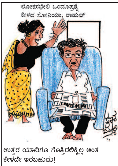
ಉತ್ತರ ಯಾರಿಗೂ ಗೊತ್ತಿರಲಿಕ್ಕಿಲ್ಲ ಅಂತ ಕೇಳಿದೇ ಇರಬಹುದು!