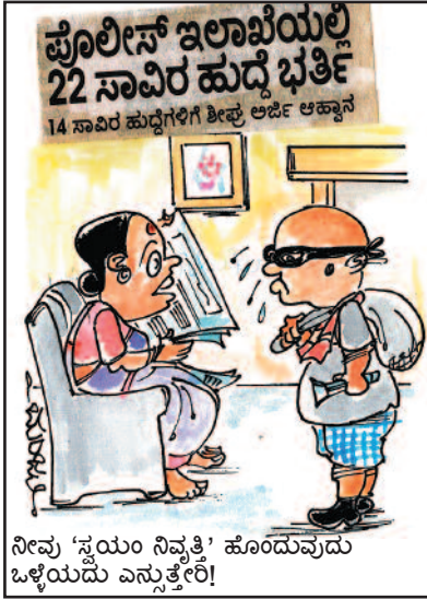
ನೀವು 'ಸ್ವಯಂ ನಿವೃತ್ತಿ' ಹೊಂದುವುದು ಒಳ್ಳೆಯದು ಎನ್ನುತ್ತೇರಿ!