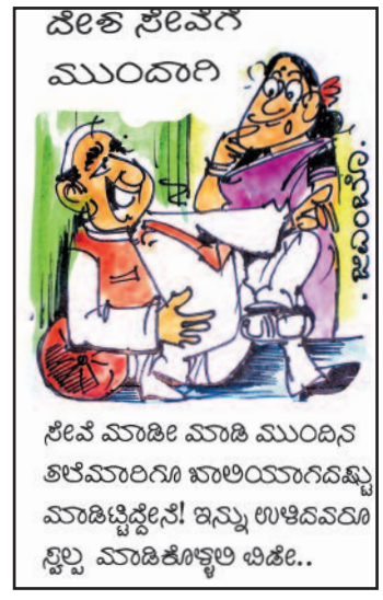
ನೀವೆ ಮಾಡಿ ಮಾಡಿ ಮುಂದಿನ ತಿಲೆಮಾರಿಗೂ ಬಾಲಿಯಾಗದಿಷ್ಟು ಮಾಡಿಟ್ಟಿದ್ದೀನಿ! ಇನ್ನು ಉಳಿದವರೂ ನ್ವಿಲ್ಲ ಮಾಡಿಕೊಳ್ಳಲಿ ಬಿಡಿ..