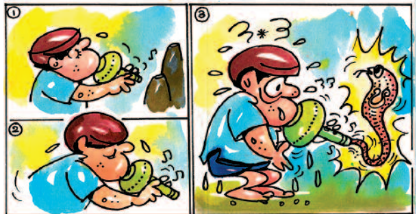
• ಏಕನಿಧಿ - ಚೊಂಗಾಳೆ •