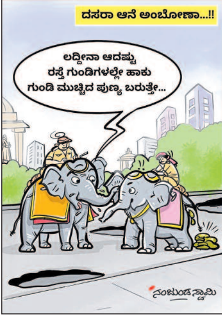
ದಸರಾ ಆನೆ ಅಂಬೋಣಾ...!!