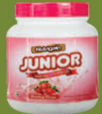
4 ಲಂದ 12 ವರ್ಷ ಮಕ್ಕಳ ಬೆಳವಣಿಗೆಗಾಗಿ ನ್ಯೂಟ್ರಿಗೈನ್ ಜೂನಿಯರ್