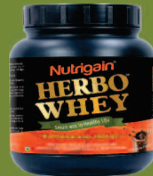
ಛಾಡಿ ಜಲದಿ ಮಾಡಲು ಹಬೋವೇ