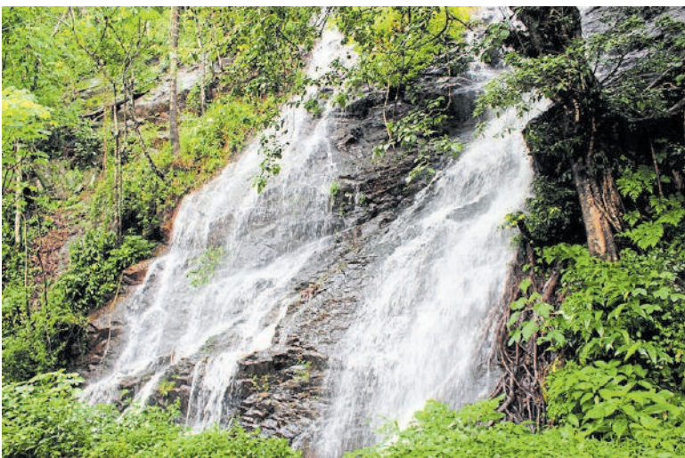
ಕೊಡಗಿನಲ್ಲಿ ಸುರಿದಿರುವ ಮಳೆಗೆ ಜಲಪಾತಗಳ ಸಂಭ್ರಮ. ಮಡಿಕೇರಿಯಿಂದ ಸಿದ್ಧಾಪುರಕ್ಕೆ ತೆರಳುವ ಮಾರ್ಗದಲ್ಲಿನ ಬ್ಯಾಲ ಜಲಪಾತ ಪ್ರವಾಸಿಗರ ನಲ್ವಾಣಗಳಲ್ಲಿ ಒಂದಾಗಿದೆ.

ಧರ್ಮಸ್ಥಳದಲ್ಲಿಯೂ ಇದೇ ಮಾದರಿಯನ್ನು ಅನುಸರಿಸಿ ಭಕ್ತರಿಗೆ ದರ್ಶನದ ಅವಕಾಶ ಕಲ್ಪಿಸಲಾಗಿದೆ. ಸ್ಯಾನಿಟೈಸರ್ ಹೆಚ್ಚು ಆದ್ಯತೆ ನೀಡಿ ಭಕ್ತರನ್ನು ದೇವಸ್ಥಾನದೊಳಗೆ ಬಿಡಲಾಗುತ್ತದೆ. ದೇವಸ್ಥಾನದಲ್ಲಿ ಅನ್ನದಾನದ ಪರಂಪರೆಗೆ ಚ್ಯುತಿ ಬರಬಾರದು ಎಂಬ ಕಾರಣಕ್ಕೆ ಭಕ್ತರಿಗೆ ಊಟದ ವ್ಯವಸ್ಥೆ ಮಾಡಲಾಗಿದೆ. ಬಹಳ ದೂರದಿಂದ ಬರುವ ಭಕ್ತರಿಗೆ ಊಟದ ಅವಶ್ಯಕತೆ ಇರುತ್ತದೆ. ಆದ್ದರಿಂದ ಸ್ವಚ್ಛತೆಗೆ ಆದ್ಯತೆ ನೀಡಿ ಮಧ್ಯಾಹ್ನ ಊಟದ ಪ್ರಸಾದ ನೀಡಲಾಗುತ್ತಿದೆ. ಪದೇಪದೇ ಸ್ಯಾನಿಟೈಸರ್ ಮಾಡುವುದು, ಬಿಸಿನೀರು