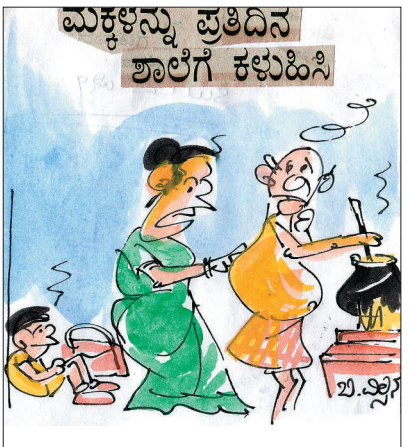
ಪ್ರತಿದಿನ ಒಂದೇ ರುಚಿಯ ಊಟ, ಮಕ್ಕಳು ಶಾಲೆಗೆ ಹೋಗೋಲ್ಲಂತ ಹರ ಮಾಡ್ತಿದ್ದಾರೆ ಕಣ್ಣೆ...