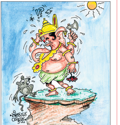
ಅಯ್ಯೋ ಪ್ರಭುವೆ, ನಾವು ಬಳ್ಳಾರಿಯಲ್ಲಿ ಭೂಸ್ವರ್ಕ ಮಾಡಿದ್ದೇವೆ! ಇಲ್ಲಿ ಭೂಮಿಯೇ ಇಲ್ಲ. ಆಳವಾದ ಕಂದಕಗಳೇ ತುಂಬಿವೆ!