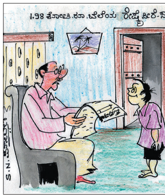
ಲೋ... ಪುಟ್ಟಾ.. ನಿಮ್ಮ ಮಮ್ಮ ಕಣ್ಣಿಗೆ ಬೀಳದಂತೆ ಈ ಪೇಪರನ್ನು ಬಚ್ಚಿಡು ನೀನು ಕೇಳಿದ್ದಲ್ಲಾ ಕೊಡಿಸ್ತಿನಿ.....