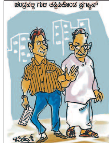
ಪ್ರಗ್ಯಾನ್ ಒಳ್ಳೆಯ ಫೋಟೋಗ್ರಾಫರ್ ಅಂದ್ಲೊಂದಿದ್ದೆ! ಬುದ್ಧಿವಂತ ಡ್ರೈವರ್ ಕೂಡ!