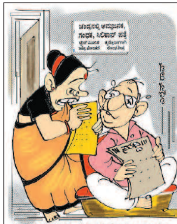
ನನಗೆ ಕೆಲವು ಅಗತ್ಯ ವಸ್ತುಗಳು ಬೇಕಿತ್ತು. ಅಲ್ಲಿ ಸಿಗುತ್ತಾ ನೋಡಿ!