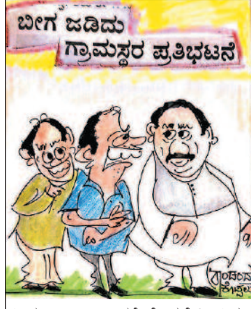
ನೀವು ಜಾಸ್ತಿ ಆಶ್ವಾಸನೆ ಕೊಡಬೇಡಿ. ನಿಮ್ಮ ಬಾಯಿಗೂ ಬೀಗ ಜಡಿದು ಪ್ರತಿಭಟನೆ ಮಾಡಬಹುದು!