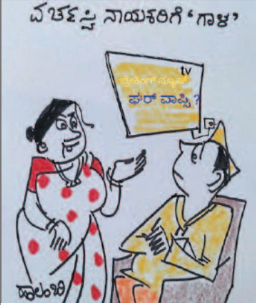
ನೀವು ವರ್ತಮಾನ ನಾಯಕರು ಹೌದಾ ಅಂತ ಈ ಬಾರಿ ತಿಳಿಯುತ್ತೆ. ಗಾಳ ಕಾಣಿಸಿದ್ರೆ ಹೌದು. ಇಲ್ಲ ಅಂದ್ರೆ ಇಲ್ಲ!