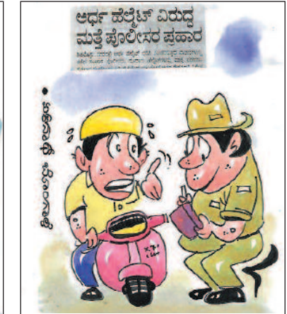
ಇದು ತೀರಾ ಅನ್ಯಾಯ ಸಾರ್! ಅರ್ಧ ಹೆಲ್ಮೆಟ್‌ಗೆ ಅರ್ಧ ದಂಡ ಮಾತ್ರ ವಿಧಿಸಬೇಕಿತ್ತು!