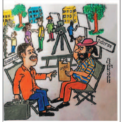
ಸಿನಿಮಾ ಬಜೆಟ್ ಖಾಲಿ. ಪ್ರಚಾರಕ್ಕೆ ನಾಲ್ಕು ವಿವಾದಾತ್ಮಕ ಸಂಭಾಷಣೆ ಮತ್ತು ಒಂದೆರಡು ದೃಶ್ಯ ಸೇರಿಸಿ ಟ್ರೈಲರ್ ಬಿಡಿ. ಪ್ರಚಾರ ಸಿಕ್ಕ ಮೇಲೆ ಆ ಭಾಗವನ್ನು ಕತ್ತರಿಸಿ ಸಿನಿಮಾ ಬಿಡುಗಡೆ ಮಾಡೋಣ!