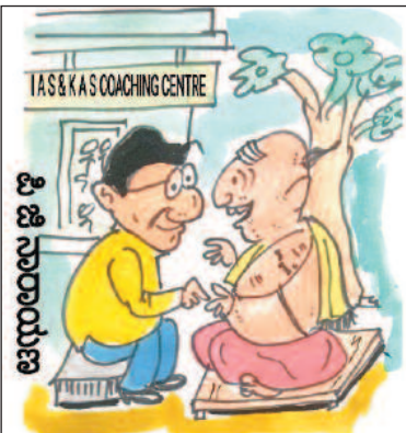
ನಿಮ್ಮ ಮಕ್ಕಳಿಬ್ಬರೂ ಈ ಕೋಚಿಂಗ್ ಸೆಂಟರ್‌ಗೆ ಹೋಗುತ್ತಾ ಇದ್ದುದನ್ನು ಕಂಡೇ ನಿಮ್ಮ ಮಕ್ಕಳ ಭವಿಷ್ಯ ಹೇಳಿದ್ದು, ಒಬ್ಬ ಐಎಎಸ್ ಮತ್ತು ಇನ್ನೊಬ್ಬ ಕೆಎಎಸ್ ಅಧಿಕಾರಿಗಳು ಆಗ್ತಾರೆ ಅಂತ!