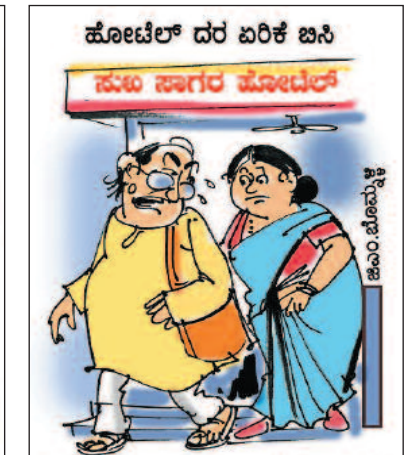
ತಿಂಡಿ ತಿಂದು ಬಿಲ್ ಕೊಟ್ಟು ಬಳಿಕ ದುಬು ಸಾಗರ ಒಳಹೊಕ್ಕು ಬಂದ ಅನುಭವ ಆಗ್ಗಿದೆ ಕಣೆ!