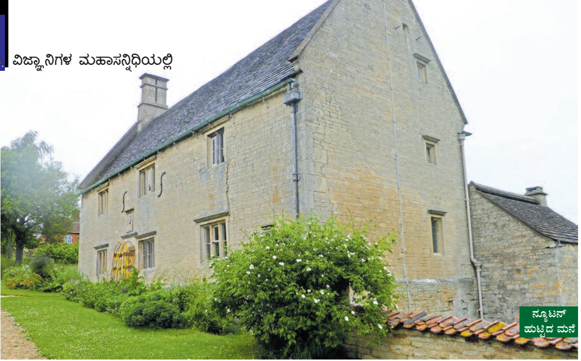
ನ್ಯೂಟನ್ ಹುಟ್ಟಿದ ಮನೆ