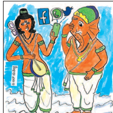
ಈ ಸಾರಿ ಬೆಂಗಳೂರಿಗೆ ಹೋಗುವಾಗ ಇದನ್ನು ತೆಗೆದುಕೊಂಡು ಹೋಗು... ನಿನ್ನ ಭಕ್ತರೆಲ್ಲಾ ಈಗ ಇದರಲ್ಲೇ ಸಿಗುತ್ತಾರೆ!