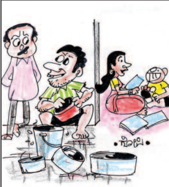
ಮಗನ 'ಹೋಂ ವರ್ಕ್' ಹೆಂಡ್ತಿ ಮಾಡುತ್ತಾಳೆ. ಅವಳ ಹೋಂ ವರ್ಕ್ ನಾನು ಮಾಡ್ತೇನೆ!