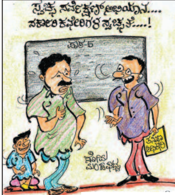
ರೀ ಮಾಸ್ಟೇ ನಿಮಗೆ ಪಾಠ ಮಾಡ್ತಿ ಅಂತ ಯಾರ್ ಹೇಳ್ತಾರೆ... ಮೊದ್ಲು ಶೌಚಾಲಯ, ಅಡುಗೆ ಮನೆ ಕ್ಲೀನ್ ಮಾಡ್ತೀ...!