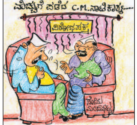
ಅಲ್ಲರೀ.. ಅವು ಪ್ರಣಾಳಿಕೆಯಲ್ಲಿ ಇಲ್ಲದ್ದನ್ನೆಲ್ಲ ಮಾಡ್ತಾ ಇದಾರೆ... ನಾವ್ಯಾಗಿ ಸುಮ್ಮಿರೋದು...!