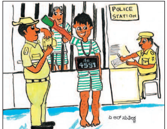
ನನ್ನ ಮೊಬೈಲ್‌ನಲ್ಲೂ ಫೋಟೋ ತೆಗೆದುಕೊಡಿ ಸರ್...!