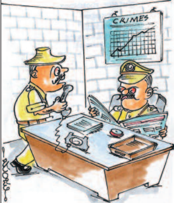
ಲೋಫರ್, ಈಡಿಯಟ್ ಅಂತ ಮಾತನಾಡುತ್ತಿದ್ದಾನೆ. ಅಂದ್ರೇಲೆ ನಮ್ಮ ಇಲಾಖೆಯವನೇ ಇರಬೇಕು ಸಾರ್!