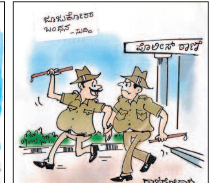
ಇವತ್ತು ಕನಿಷ್ಠ ನಾಲ್ಕು ಜನ ಜೂಜುಕೋರರನ್ನಾದ್ರೂ ಹಿಡೀತೀನಿ... ಬೇಕಿದ್ದ ಬೆಟ್ ಕಟ್ಟು...