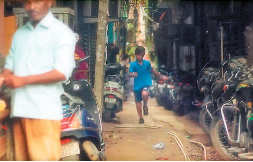
ಪುಸ್ತಕಗಳ ಪ್ರಚಾರದ ವಿಡಿಯೋಗಳು..