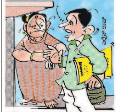
ನನಗೂ ಅದೇ ಅನುಭವ ಆಯ್ತು ಕಣೆ. ವಾರದಲ್ಲಿ ಒಂದು ದಿನ ಆದರೂ ಕೆಲಸ ಮಾಡಿ ಅಂತ ಸಾಹೇಬ್ರು ಕಾಲು ಹಿಡ್ತೊಂಡು ಬಿಟ್ಟು!