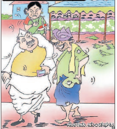
ಊಟಕ್ಕೂ ಬಣ್ಣ ಹಚ್ಚಿಬಿಟ್ಟೀರಾ? ಬನ್ನಿ ಸ್ವಾಮಿ ಊಟ ಮಾಡ್ತೊಂಡು ಹೋಗುವಿರಂತೆ!