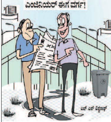
ಅನುಕಂಪದ ಆಧಾರದಲ್ಲಿ ವರ್ಗಾವಣೆ ಮಾಡಿದ್ದಾರೆಂತೆ!