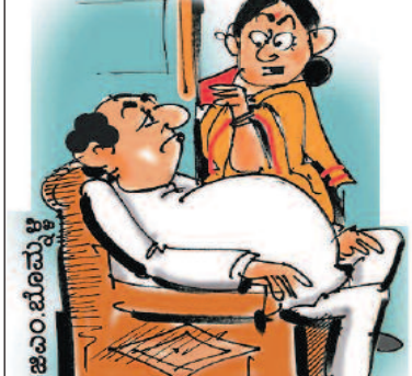
ಯಾರ ಹಸಿವು ಅನ್ನೋದೊಂದೇ ನನಗೂ ಕಾಡುವ ಅನುಮಾನ?