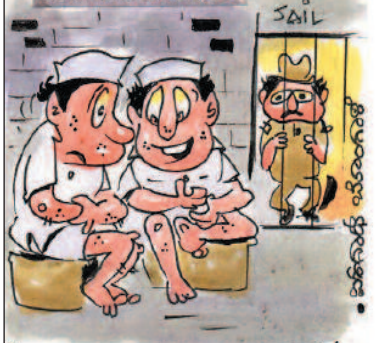
ನಮ್ಮ ಕನಿಷ್ಠ ಮಟ್ಟದ ಜೀವನ ಅಂದ್ಕೊಬೇಡಣ್ಣೋ! ಅಲ್ಲೋಡು ನಮ್ಮ ಭೇಟಿಗೂ 'ವಿವಿಪಿ'ಗಳಂತೆ ಸಮಯ ನಿಗದಿ ಮಾಡಿದ್ದಾರೆ!