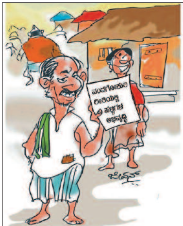
ರಾಮರಾಜ್ಯ, ನಂದಗೋಕುಲ 'ಎಸ್ಕುಗಳು ಕೇಳೋಕೆ ಶಾನ ಸಂದಾಕೆ'!