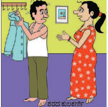
ಏನು, ಮಾತು ಮಾತಿಗೂ ಡಾರ್ಲಿಂಗ್, ಡಾರ್ಲಿಂಗ್ ಅನ್ನುತ್ತಿದ್ದೀರಲ್ಲ. ಕುಡಿದು ಬಂದಿದ್ದೀರಾ ಹೇಗೆ?