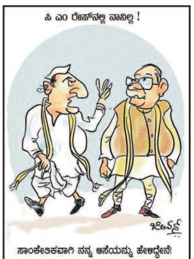
ಸಾಂಕೇತಿಕವಾಗಿ ನನ್ನ ಆಸೆಯನ್ನು ಹೇಳಿದ್ದೇನೆ!

ಪ್ಯಾಕೇಜ್ ಟೂರ್‌ನಲ್ಲಿ ಸೀನಿಯರ್ ಸಿಟಿಜನ್ ಹಾಗೂ ಹನಿಮೂನ್ ಕಪಲ್ಸ್ ಒಟ್ಟಿಗೆ ಬಸ್ ಏರಿದರು. ತಕ್ಷಣವೇ ಗೈಡ್ ಬಂದು, 'ಕೈಗೆ ಮೆಹಂದಿ ಹಾಕಿದವರು ಬಸ್ಸಲ್ಲಿ ಹಿಂದೆ ಕೂತ್ಕೊಳ್ಳಿ ಮತ್ತು ತಲೆಗೆ ಮೆಹಂದಿ ಹಾಕಿದವರು ಮುಂದಿನ ಸೀಟ್‌ಗಳಲ್ಲಿ ಕೂತ್ಕೊಳ್ಳಿ' ಎಂದ.