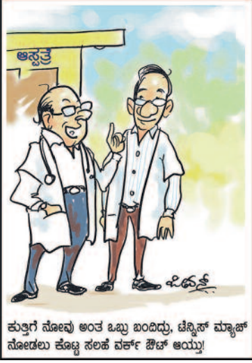
ಕುತ್ತಿಗೆ ನೋವು ಅಂತ ಒಬ್ಬ ಬಂದಿದ್ದು, ಟೆನ್ಷನ್ ಮ್ಯಾಷ್ ನೋಡಲು ಕೊಟ್ಟ ಸಲಹೆ ವರ್ಕ್ ಔಟ್ ಆಯ್ತು!

ಅಪ್ಪ: ಯಾಕೋ ಶಾಲೆಗೆ ಹೋಗಿಲ್ಲ? ಬೆಂಟು: ನಿನ್ನ ನಮ್ಮನ್ನೆಲ್ಲಾ ತೂಕ ಮಾಡಿದ್ದಾರೆ ಇವತ್ತು ಮಾರಿ ಬಿಡಾರೇನೋ ಅಂತ ಹೋಗಿಲ್ಲ.