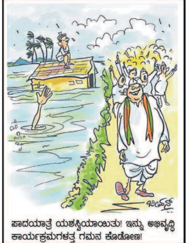
ಪಾದಯಾತ್ರೆ ಯಶಸ್ವಿಯಾಯಿತು! ಇನ್ನು ಅಜವೃದ್ಧಿ ಕಾರ್ಯಕ್ರಮಗಳತ್ತ ಗಮನ ಕೊಡೋಣ!

ಮಿಕ್ಕಿ ಕೊಳ್ಳಲೆಂದು ದಂಪತಿ ಅಂಗಡಿಗೆ ಹೋಗಿದ್ದಾಗ, ಬಹಳ ಸಮಯದಿಂದ ಗಂಡ ಸೇಲ್ಸ್ ಗರ್ಲನ್‌ನೇ ನೋಡುತ್ತಿದ್ದ. ಇದರಿಂದ ಕುಪಿತಗೊಂಡ ಹೆಂಡತಿ ಗಂಡನ ಭುಜ ತಟ್ಟಿ ಹೇಳಿದಳು 'ಎಕ್ಸ್‌ಚೇಂಜ್' ಆಫರ್ ಇರುವುದು ಮಿಕ್ಕಿ ಮೇಲೆ ಮಾತ್ರ!