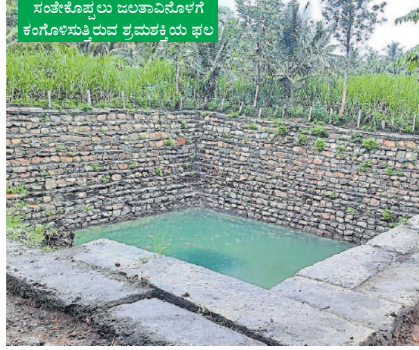
ಸಂತೆಕೊಪ್ಪಲು ಜಲತಾವಿನೊಳಗೆ ಕಂಗೊಳಿಸುತ್ತಿರುವ ಶ್ರಮಶಕ್ತಿಯ ಫಲ

ಹೋದವು! ಸದ್ಯದ ನಮ್ಮ ಅಂದಾಜಿನಂತೆ ಹಾಸನ ಜಿಲ್ಲೆಯಲ್ಲಿ 800ರಿಂದ 1000 ಕಲ್ಯಾಣಿಗಳಿರುವ ಸಾಧ್ಯತೆ ಇದೆ. ಅದರ ಸಮೀಕ್ಷೆ ನಡೆಯಬೇಕಿದೆ.