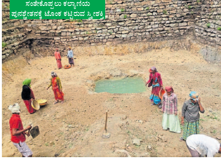
ಸಂತೆಕೊಪ್ಪಲು ಕಲ್ಯಾಣಿಯ ಪುನಶ್ಚೇತನಕ್ಕೆ ಟೊಂಕ ಕಟ್ಟಿರುವ ಸ್ತ್ರೀಶಕ್ತಿ