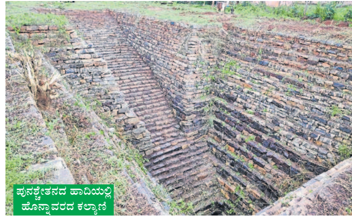
ಪುನಶ್ಚೇತನದ ಹಾದಿಯಲ್ಲಿ ಹೊನ್ನಾವರದ ಕಲ್ಯಾಣಿ