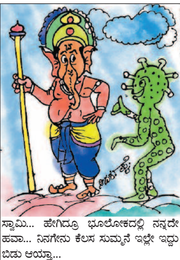
ಸ್ವಾಮಿ... ಹೇಗಿದ್ದೂ ಭೂಲೋಕದಲ್ಲಿ ನನ್ನದೇ ಹವಾ... ನಿನಗೇನು ಕೆಲಸ ಸುಮ್ಮನೆ ಇಲ್ಲೇ ಇದ್ದು ಬಿಡು ಆಯ್ತಾ...