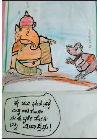
ಈ ಬಾರಿ ಭೂಲೋಕಕ್ಕೆ ಮಾನ್ಯ ದಾಳಿ ಕಂಡು ನೀನು ಬುಕಿಲೆ ಡೋಗಿ ಬ್ಲಿ ಮೊದಲನೆಯ!