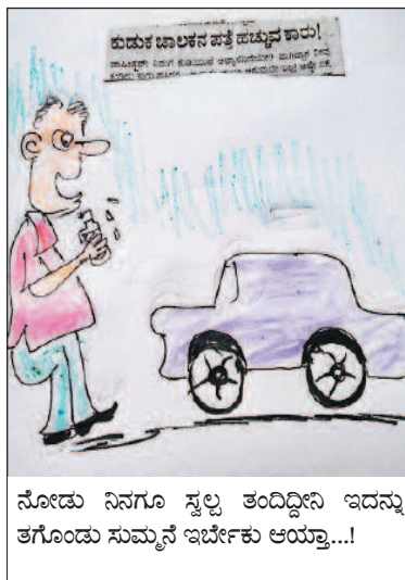
ನೋಡು ನಿನಗೂ ಸ್ವಲ್ಪ ತಂದಿದ್ದೇನಿ ಇದನ್ನು ತಗೊಂಡು ಸುಮ್ಮನೆ ಇರ್ಬೇಕು ಆಯ್ತಾ...!