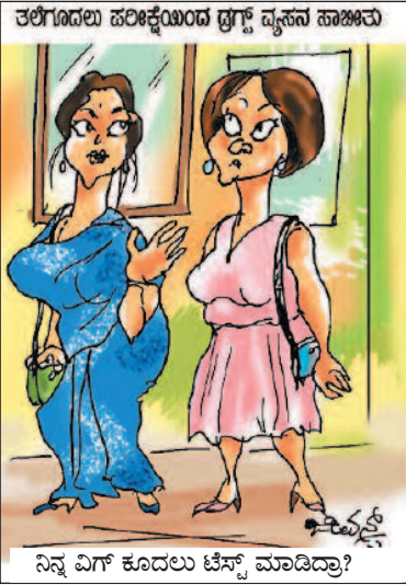
ತಲೆಗೂದಲು ಪರಿಚ್ಛೇದಿಸಿದ ಡ್ರಾಗ್ಸ್ ವ್ಯಸನ ಹಾಜರವು ನಿನ್ನ ವಿಗ್ ಕೂದಲು ಟೆಸ್ಟ್ ಮಾಡಿದ್ರಾ?