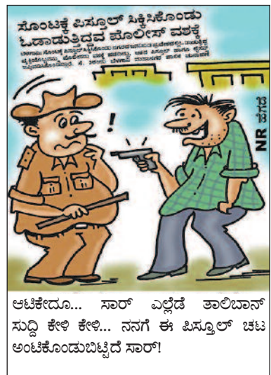
ಸೊಂಟಕ್ಕೆ ಲಿಸ್ತೂಲ್ ಸಿಕ್ಕಿಸಿಕೊಂಡು ಓಡಾಡುತ್ತಿದ್ದವ ಜೊಲೀಸ್ ವಶಕ್ಕೆ ಆರೋಪಿಸಿಕೊಳ್ಳುವ ಸ್ವಾಮಿ... ಅಂತಹವರನ್ನು ಬಿಡುಬಿಡು ಮಾಡಬೇಡಿ... ಅಟಕೇದೂ... ಸಾರ್ ಎಲ್ಲೆಡೆ ತಾಲಿಬಾನ್ ಸುದ್ದಿ ಕೇಳಿ ಕೇಳಿ... ನನಗೆ ಈ ಫಿಸ್ತೂಲ್ ಚಟ ಅಂಟಿಕೊಂಡುಬಿಟ್ಟಿದೆ ಸಾರ್!