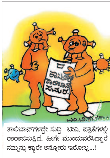
ತಾಲಿಬಾನ್‌ಗಳದ್ದೇ ಸುದ್ದಿ ಟಿವಿ, ಪತ್ರಿಕೆಗಳಲ್ಲಿ ರಾರಾಜಿಸುತ್ತಿದೆ. ಹೀಗೇ ಮುಂದುವರಿಸಿದ್ದಾರೆ ನಮ್ಮನ್ನು ಕ್ಯಾರೇ ಅನ್ನೋರು ಇರೋಲ್ಲ...!