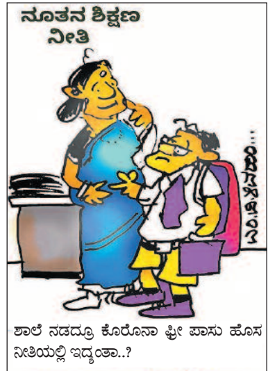
ನೂತನ ಶಿಕ್ಷಣ ನೀತಿ ಶಾಲೆ ನಡದ್ರೂ ಕೊರೊನಾ ಫೀ ಪಾಸು ಹೊಸ ನೀತಿಯಲ್ಲಿ ಇದ್ದಂತಾ..?