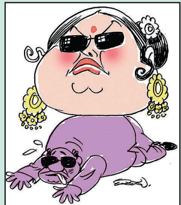
ಆವರಿಸುವುದು ಕಡಿಮೆ, ಸಾವರಿಸುವುದು ಹೆಚ್ಚಾದ್ದರಿಂದ!