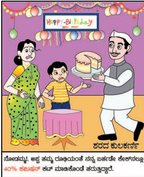
ನೋಡಮ್ಮ! ಅಷ್ಟ ತಮ್ಮ ರೂಢಿಯಂತೆ ನನ್ನ ಬರ್ತಂಡೇ ಕೇಕ್‌ನಲ್ಲೂ 40% ಕಟುಷ್ಣ ಕಟ್ ಮಾಡಿಕೊಂಡೆ ತರುತ್ತಿದ್ದಾರೆ.