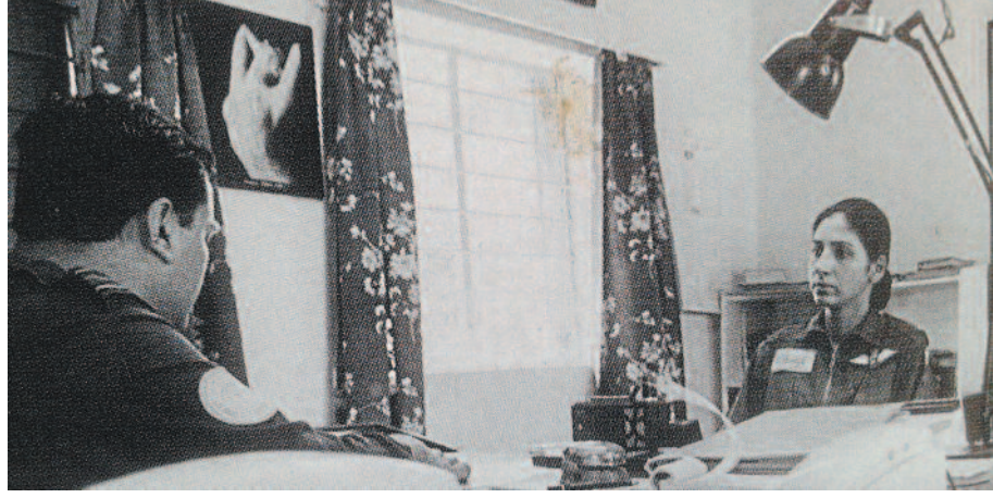
ವಾಯುಪಡೆಯ ಪುರುಷ ಅಧಿಕಾರಿಯ ಕಚೇರಿಯ ಗೋಡೆಯ ಮೇಲೆ ಹೆಂಗಸಿನ 'ಪಿನ್ ಅಪ್' ಪೋಸ್ಟೊ

ಗುಂಜನ್ ಹಾರಾಟವನ್ನು ತಮ್ಮ ವೃತ್ತಿಯಾಗಿ ಏಕಾಏಕಿ ಆಯ್ದುಕೊಳ್ಳಲಿಲ್ಲ. ಅಪ್ಪನಂತೆ, ಗುಂಜನ್ಗೆ ಯಂತ್ರಗಳಲ್ಲಿ ಆಸಕ್ತಿ ಇತ್ತು. ಒಮ್ಮೆ ವಿಮಾನದ ಕಾಕ್‌ಪಿಟ್ ಒಳಹೊಕ್ಕು ನೋಡಲು ಸಿಕ್ಕ ಅವಕಾಶ ಗುಂಜನ್ಗೆ ಆಗದ ಹಾರಾಟವನ್ನು ಮತ್ತಷ್ಟು ಆಕರ್ಷಕವಾಗಿಸಿತ್ತು. ಒಂಬತ್ತನೇ ತರಗತಿಗೆ ಬರುವ ಹೊತ್ತಿಗಾಗಲೇ ತಾನು ಪೈಲಟ್ ಆಗುವುದಾಗಿ ನಿಶ್ಚಯಿಸಿದ್ದರು. ದಿಲ್ಲಿ