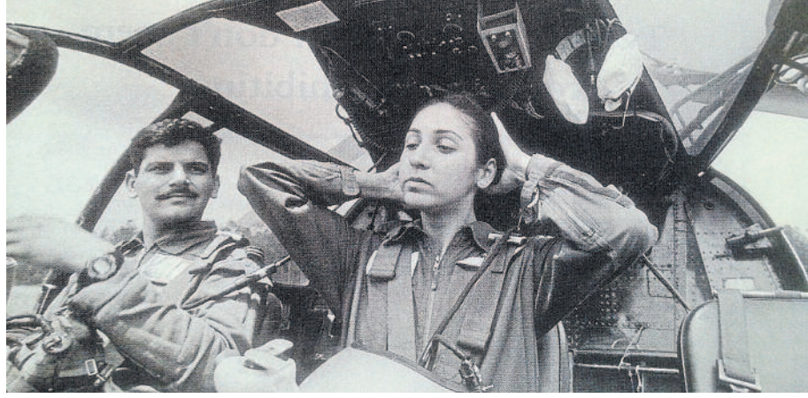
ವಾಯುಪಡೆಯ ಪ್ರಥಮ ಹೆಲಿಕಾಪ್ಟರ್ ಪೈಲಟ್ ಚೇಲ್ ದತ್ತಾ