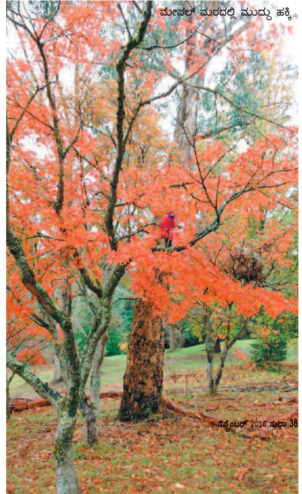
ಮೇಪಲ್ ಮರದಲ್ಲಿ ಮುದ್ದು ಹಕ್ಕಿ

ಪ್ರಖಿರ ಬಿಸಿಲಿಗೆ ಸನ್‌ಸ್ಕ್ರೀನ್ ಮುಲಾಮು ಬೇಕೇ ಬೇಕು. ಆಸ್ಟ್ರೇಲಿಯನ್ನರು ಧೈರ್ಯಶಾಲಿಗಳು, ಅತ್ಯುತ್ತಮ ಹಿಗ್ಗು ಮತ್ತು ತುಂಬ ಸ್ನೇಹಪರರು. ಶರೀರಮಾಟ, ಆರೋಗ್ಯಕ್ಕೆ ತುಂಬ ಗಮನ ಕೊಡುತ್ತಾರೆ. ಮೋಜು ಪ್ರಿಯರು. ಕೆಲ ಸಲ ಇಲ್ಲಿ ನಾಲವಾರು ದಿನ ಮಳೆ ಮೋಡ ಮುಸುಕಿದ್ದು, ಇದ್ದಕ್ಕಿದ್ದಂತೆ ಒಂದು ಬೆಳಿಗ್ಗೆ ಸೂರ್ಯ ಹೊಳೆಯತೊಡಗುತ್ತಾನೆ.