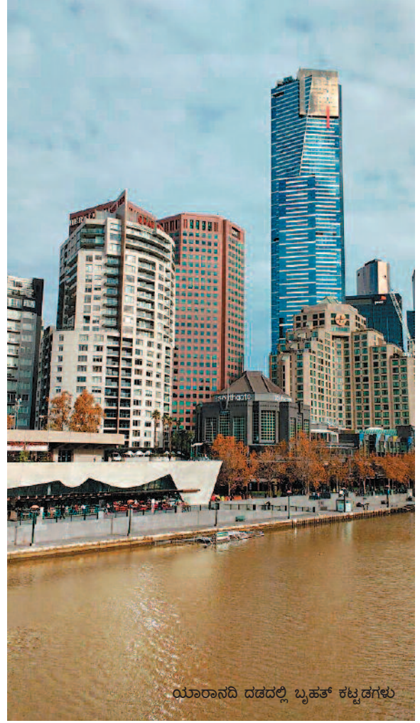
ಯಾರಾನದಿ ದಡದಲ್ಲಿ ಬೃಹತ್ ಕಟ್ಟಡಗಳು