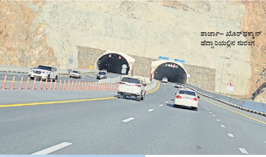
ಶಾರ್ಜಾ- ಖೊರ್ಫಕ್ವಾನ್ ಹೆದ್ದಾರಿಯಲ್ಲಿನ ಸುರಂಗ