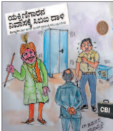
ಈ ತಗೊಂಡು ತೆರೆಯಲಿಕ್ಕೆ ಹೋದ ತಕ್ಷಣ ಲಾಕರ್ ಮಾಯವಾಗಿವೆ ಸರ್!