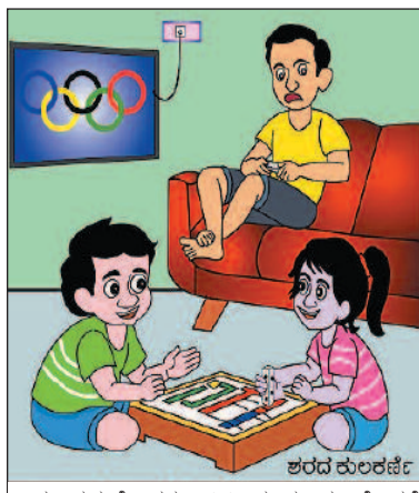
ಅಪ್ಪ ನಮಗೆ ಹತ್ತು ನಿಮಿಷ ಕೂಡ ಹೊರಗೆ ಆಡಲು ಬಿಡುವುದಿಲ್ಲ. ಓಲಿಂಪಿಕ್ಸ್‌ನಲ್ಲಿ ಮಾತ್ರ ಭಾರತಕ್ಕೆ ಚಿನ್ನದ ಪದಕಗಳು ಬೇಕು ಅಂತಾರೆ!