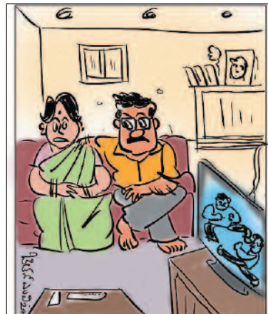
ಈ ಸಿನಿಮಾ ಫೈಟ್ ಜೋರಾಯ್ತು. ಎಚ್‌ಡಿಕ್ - ಡಿಕ್‌ಶಿ ಫೈಟ್ ನೋಡೋಣ ಹಾತ್ರೇ!