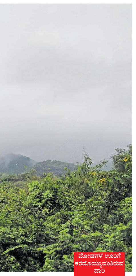
ಮೋಡಗಳ ಊರಿಗೆ ಕರದೊಯ್ಯುವಂತಿರುವ ದಾರಿ