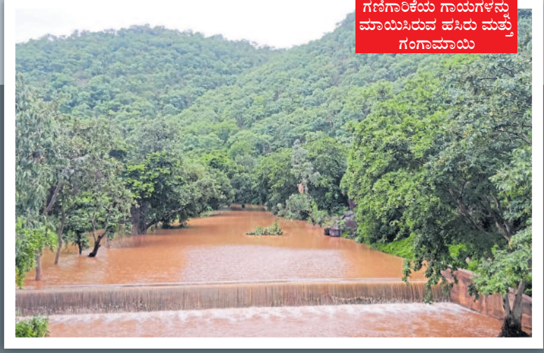
ಗಣಿಗಾರಿಕೆಯ ಗಾಯಗಳನ್ನು ಮಾಯಿಸಿರುವ ಹೆಸರು ಮತ್ತು ಗಂಗಾಮಾಯಿ