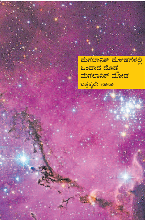
ಮೆಗಲಾನಿಕ್ ಮೋಡಗಳಲ್ಲಿ ಒಂದಾದ ದೊಡ್ಡ ಮೆಗಲಾನಿಕ್ ಮೋಡ