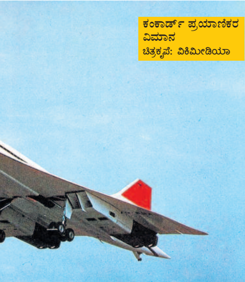
ಕಂಕಾರ್ಡ್ ಪ್ರಯಾಣಿಕರ ವಿಮಾನ