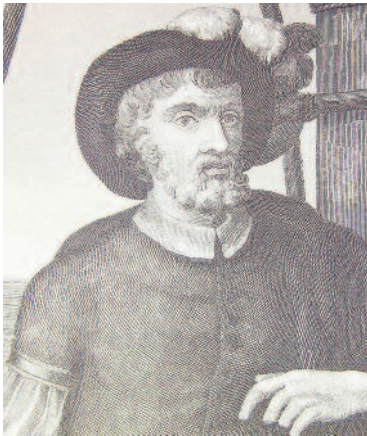
ಹ್ಯಾನ್ ಸೆಬಾಸ್ಟಿಯನ್ ಎಲ್ ಕಾನೊ