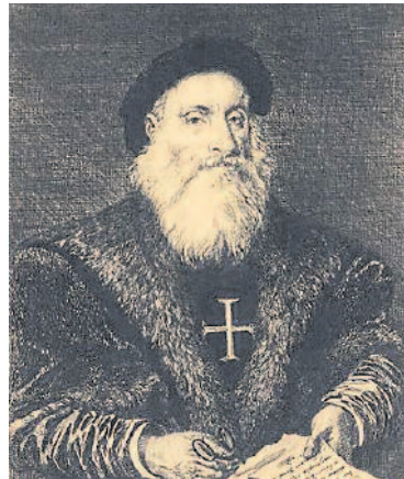
ವಾಸ್ಕೋ ಡ ಗಾಮಾ