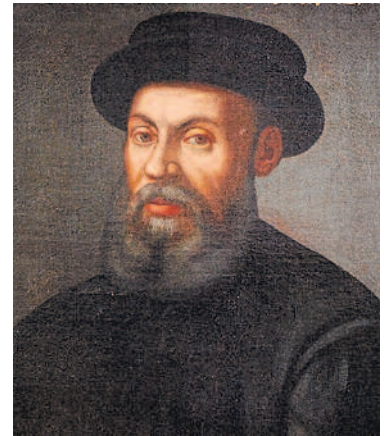
ಫೆರ್ಡಿನೆಂಡ್ ಮೆಗಲಾನ್ ಚಿತ್ರಕೃಷಿ: ಮ್ಯಾರಿನ್ಸ್ ಮ್ಯೂಸಿಯಂ