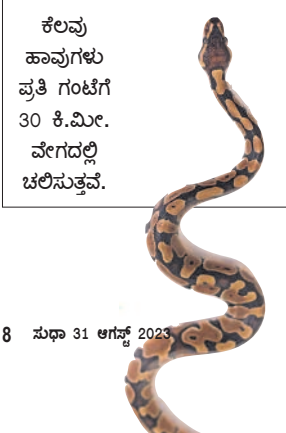
ಕೆಲವು ಹಾವುಗಳು ಪ್ರತಿ ಗಂಟೆಗೆ 30 ಕಿ.ಮೀ. ವೇಗದಲ್ಲಿ ಚಲಿಸುತ್ತವೆ.

ಹಾವಿನ ವಿಷ ಇರುವುದು, ಅದು ಬೇಟೆಯಾಡಿದ ಪ್ರಾಣಿಯನ್ನು ಜೀರ್ಣಗೊಳಿಸಲು. ಕೆಲವು ಹಾವುಗಳಿಗೆ ಅವು ವಿಷ ಹೊಂದಿರುವುದೇ ತಿಳಿದಿಲ್ಲ. ಅಕ್ಸಾಟ್ ಅವುಗಳಿಗೇ ಕಡಿದುಕೊಂಡು ಅವೇ ಸತ್ತದ್ದೂ ಇದೆ.