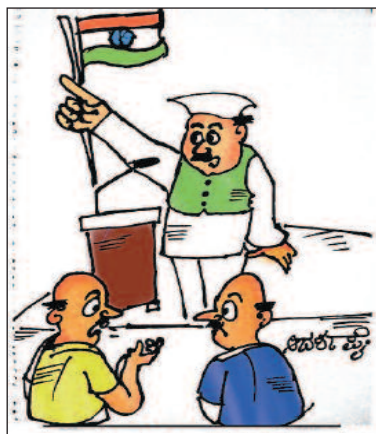
ಸತ್ತಾತ್ಮ್ಯ ದಿನಾಚರಣೆ ಯೋಧರ ಬಗ್ಗೆ ಮಾತನಾಡುವುದನ್ನು ಕೇಳೋಣ ಅಂತ ಬಂದ್ರೆ, ಇಲ್ಲಿ ವಿರೋಧ ಪಕ್ಷದ ಬಗ್ಗೆ ಹೇಳಿದ್ದಾರೆ!