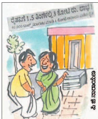
ಹಿತ್ತಲು ಮತ್ತು ಟೆರೆಸ್ ಮೇಲೆ ನಾವೂ ಬೆಳೆ ಬೆಳೆ ಕೋಟಿಧನರಾಗೋಣ ಕಣ್ಣೇ!