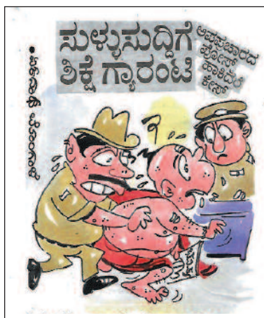
ರಸ್ತೆ ಬದಿ ಕೂತು, ಹೋಗುವವರಿಗೆ ಸುಳ್ಳು ಭವಿಷ್ಯ ಹೇಳ್ತಾ ಇದ್ದ ಸಾರ್!