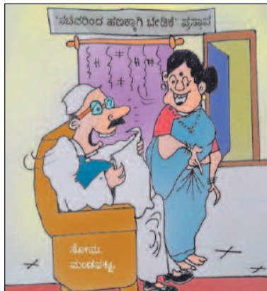
ನೀವು ಕೇಳಿದ್ದು ಸರಿಯಿದೆ ಬಿಡಿ. ಚುನಾವಣೆಯಲ್ಲಿ ಖರ್ಚು ಮಾಡಿದ್ದು ದುಡ್ಡೋಬೇಕಲ್ಲಾ?