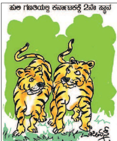
ನಗರಾಭಿವೃದ್ಧಿ ಅಂತ ಅರಣ್ಯ ನಾಶ ಆಗದಿದ್ದರೆ ನಂ1 ಆಗುತ್ತಿತ್ತು!