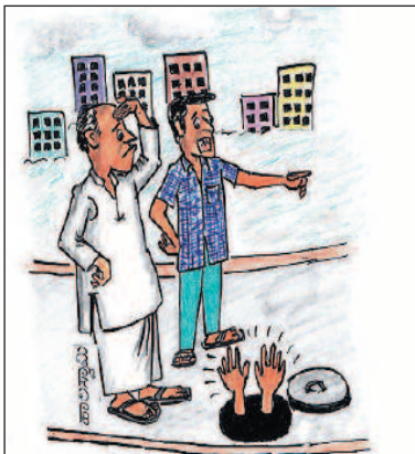
ಮೊಬೈಲ್ ನೋಡ್ಕೊಂತಾ ಅವು ಈಕಡೆ ಬಂದಿದ್ದು ನಾನೇ ಈಗ ನೋಡಿದ್ದೆ. ಇದ್ದಕ್ಕಿದ್ದಂತೆ ಎಲ್ಲಿ ಮಾಯವಾದನೋ ಗೊತ್ತಾಗುತ್ತಿಲ್ಲ!