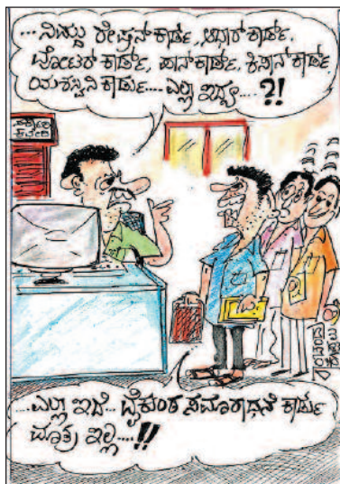
...ಎಲ್ಲು ಖಾಸು... ಫೈನಾನ್ಶಿಯಲ್ ಸರ್ವಿಸ್ ಕಾರ್ಡ್ ಪೂಕು ಬಿಲ್ಲು...!!