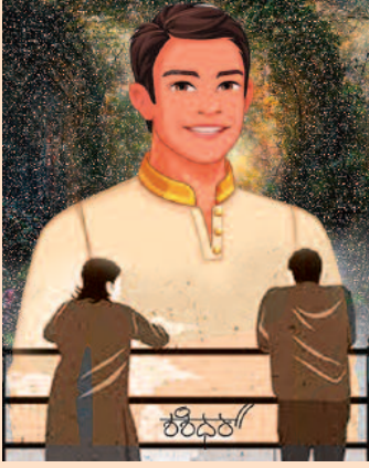
ರೂಪದ ವಿಷಯದಲ್ಲಿ ನೈಸರ್ಗಿಕ ಸ್ತ್ರೀಪುರುಷ ಸಮಾನತೆ!