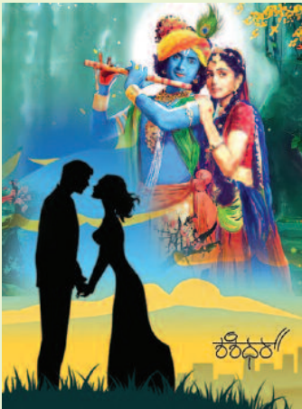
ಅಸೂಯೆ ಇಲ್ಲದೆ ಪ್ರೀತಿಸಿದ ರಾಧೆಯ ರಿತಿಯದು.