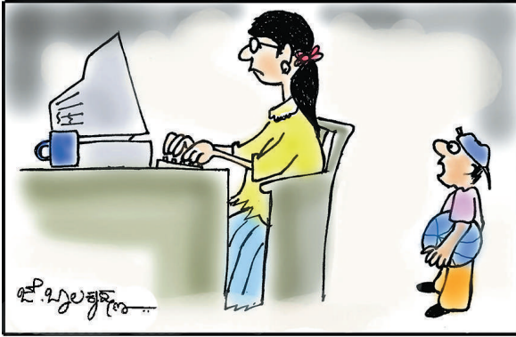
'ಏನಮ್ಮ, ಯಾವಾಗ್ಲೂ ಕಂಪ್ಯೂಟರ್ ಮುಂದೇನೇ ಕೂತಿರೀಯಿ, ನನ್ನ ಬಗ್ಗೆ ಕಾಳಜಿಗೇ ಇಲ್ಲ ನಾನೇನು ನಿನ್ನ ಹೊಟ್ಟೆಲೇ ಹುಟ್ಟಿದ್ದೋ ಅಥವಾ ನನ್ನನ್ನೂ ಇಂಟರ್ನೆಟ್‌ನಿಂದ ಡೌನ್‌ಲೋಡ್ ಮಾಡಿದೆಯೋ?'