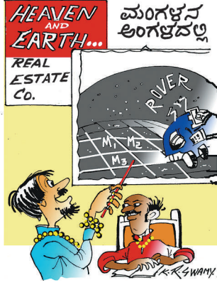
ಯಾವುದಕ್ಕೂ ಇಲ್ಲಿ ಅಂತ ಮುಂಚಿತವಾಗಿಯೇ ಮೂರು 'ಸೈಟ್'ಗಳಿಗೆ ಬುಕ್ ಮಾಡಿಬಿಟ್ಟೆ...