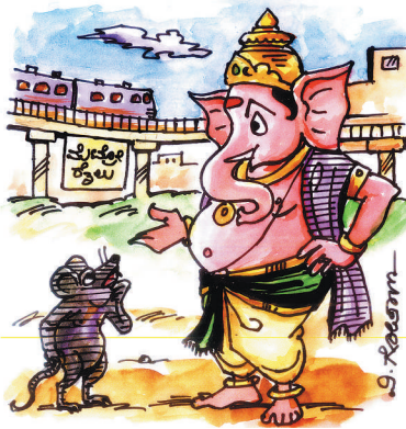
ಮೂಷಕ ನೀನು ವಿಶ್ರಾಂತಿ ತೆಗೆ, ನಾನು ಮೆಟ್ಟೋ ರೈಲಿನಲ್ಲಿ ನಗರ ಸುತ್ತಿ ಬರುತ್ತೇನೆ, ಬರುವಾಗ ಕಡುಬು ತರುತ್ತೇನೆ..