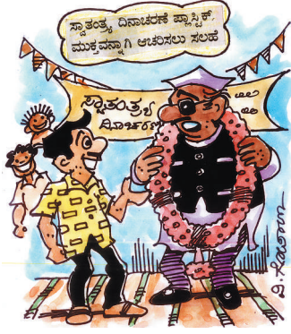
ಎಲ್ಲವನ್ನು ಪ್ಲಾಸ್ಟಿಕ್ ಮುಕ್ತವಾಗಿ ಆಚರಿಸಿದ್ದೇವೆ, ಈ ಸೈಜ್ ಹೂವಿನ ಹಾರ ಸಿಗಲಿಲ್ಲ ಅದಕ್ಕೆ ಪ್ಲಾಸ್ಟಿಕ್ ಹಾರ ಹಾಕಿದ್ದೇವೆ..!