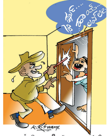
ಇದು "ಹೊಲಿ ಸೆಬಿಲೆ" ಅಲ್ಲ... ಮನೆ... ಹುಡುಗು ಕಾಫಿ ಕುಡಿದು ಗಲಾಟೆ ಮಾಡಿದವರ ಅಪ್ಪಲಿ.....