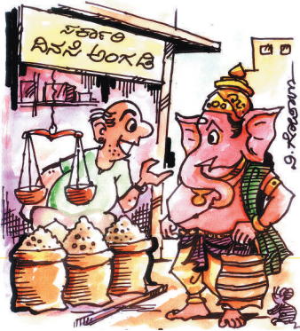
ಗಣೇಶ ನಿನ್ನ ಹತ್ತಿರ ರೇಷನ್ ಕಾರ್ಡ್ ಇದ್ದರೆ ಮಾತ್ರ ನಿನಗೆ ರೇಷನ್ ಕೊಡುವುದು ತಿಳಿತಾ!