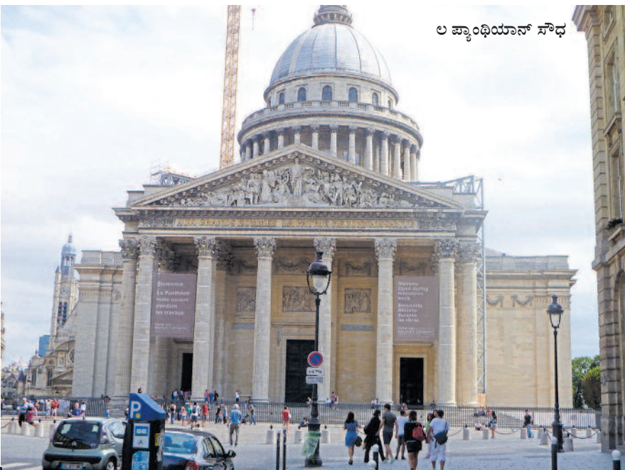
ಲ ಪ್ಯಾಂಥಿಯಾನ್ ಸೌಧ

ಹೀಗೆ ಪ್ರಾರಂಭವಾಯಿತು ಒಂದು ಚಾರಿತ್ರಿಕ ದಾಂಪತ್ಯ ಜೀವನ. ಹೆಂಡತಿ ಪ್ರಾರಂಭಿಸಿದ ಪ್ರಯೋಗಕ್ಕೆ ಪಿಯರ್ ಉಪಕರಣಗಳನ್ನು ನೀಡಿ, ಅವುಗಳ ಬಳಕೆಯಲ್ಲಿ ತರಬೇತಿಯನ್ನೂ ನೀಡಿದರು. ಇವರು ಕಣ್ಣಲ್ಲಿ ಕಣ್ಣೆಟ್ಟು ಪ್ರಯೋಗಗಳನ್ನು ಮಾಡಿದರು. ಇದರ ಫಲವೇ ರೇಡಿಯೊ ಆವಿಷ್ಕಾರವಾಯಿತು. ಇದು ಫಿನ್‌ಲ್ಯಾಂಡಿನಲ್ಲಿ ಒಂದು ಹೊಸ ಪ್ರಭೇದವನ್ನೇ ತೆರೆಯಿತು. ಇದಲ್ಲದೆ